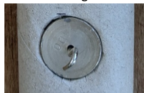
100 Gramm im Kreisausschnitt