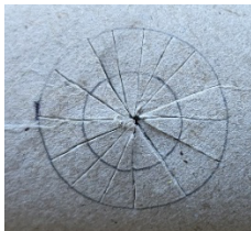
Tortenschnitt beim Kreis