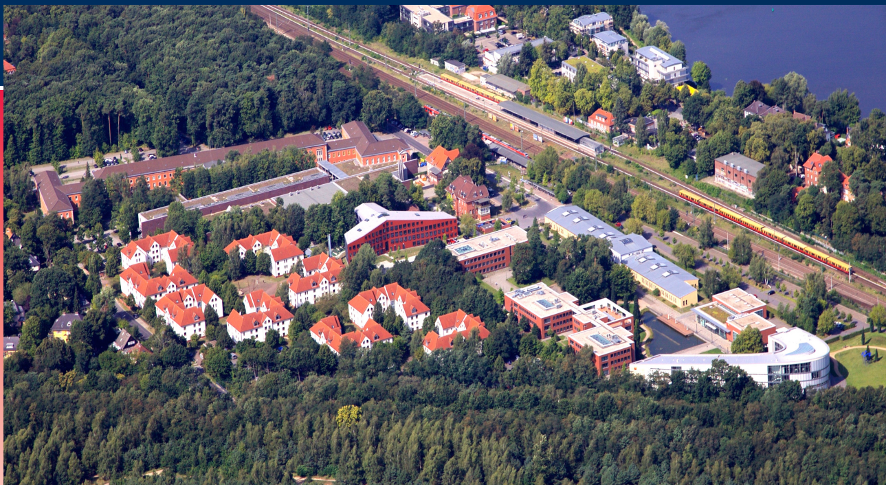
Universitätskomplex Griebnitzsee aus der Luft: