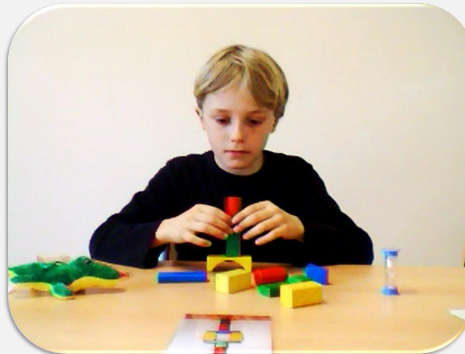
(Rohlf & Krahé, 2015)

N = 599 Kinder (50.8% weiblich) Alter T1 : M = 8.11 ( SD = 0.92 ) Range 6.37 – 10.49